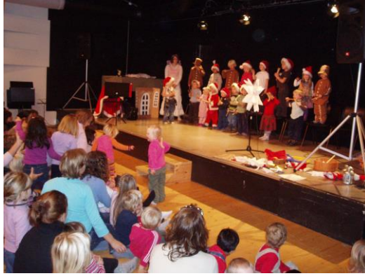
L'Eikestua opptro for ca.150 stykker på kulturlåven